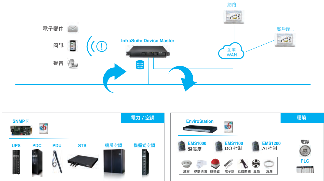
圖 1. Delta InfraSuite Device Master 監控應用

除監控設備外，如果您需要完善的 DCIM 解決方案時，InfraSuite Device Master 是移轉至 InfraSuite Manager 最簡單的方式。InfraSuite Manager 是功能齊全的台達 DCIM 軟體解決方案。