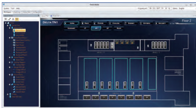
圖 2. 導覽圖形

InfraSuite Device Master 將所有歷史事件和資料均儲存於資料庫中，使用者可使用此資料進行分析，此外，亦可依據使用者的偏好自動備份資料庫。