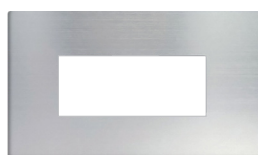
Elegant Silver (エレガントシルバー)