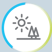
高演色性媲美陽光